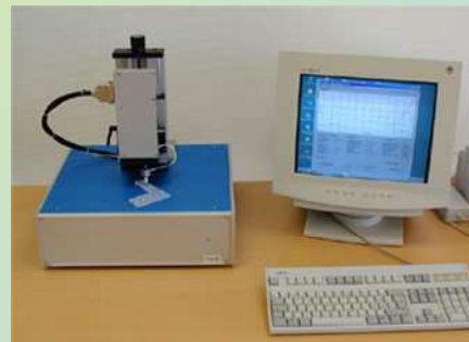
Präzisionsmessgerät Kraft-Weg mit der Messung von Strom und Spannung.

Nehmen Sie direkt Kontakt mit uns auf: Tel: +41 44 941 90 50, Mail: info@tea-ag.ch .