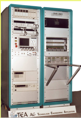
Designverifikation von Soft- und Hardware in der Entwicklung.

Hier einige Beispiele von TEA-Testsystemen für unterschiedliche Anwendungen: