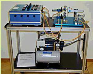
Lebensdauertester von Schaltern.