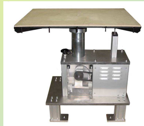
Rüttler zur Zulassung von Feuerwerkskörpern. Genutzt auch von der BAM in Deutschland.